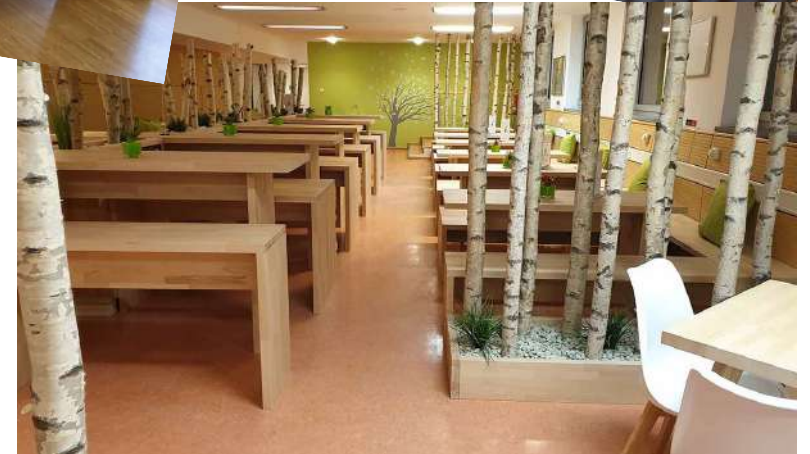
Schaffung eines Schultreffs